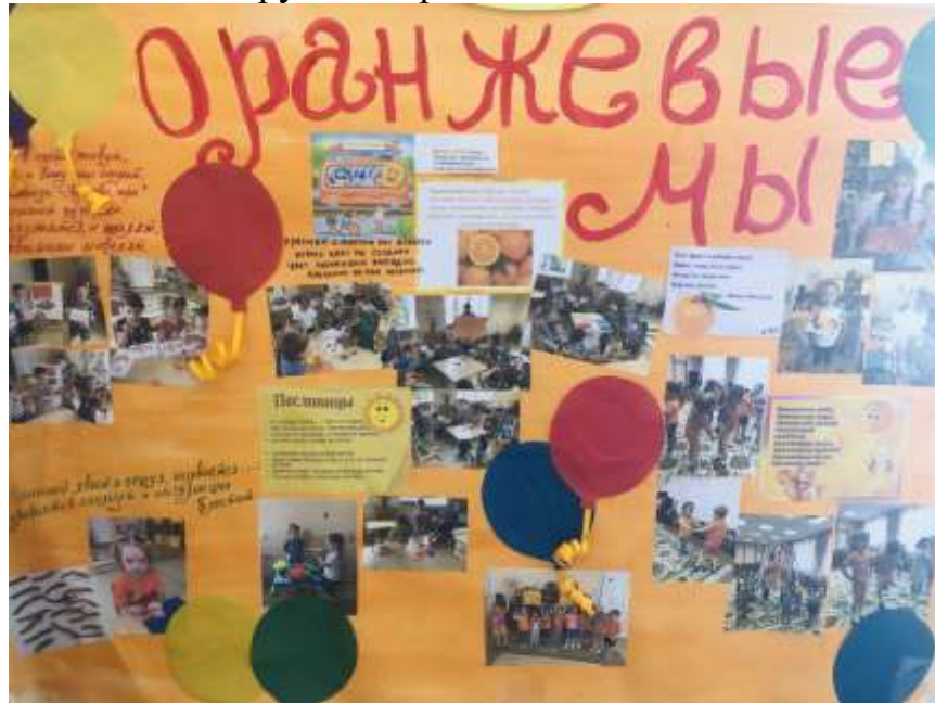
Детям было очень интересно изучать данную тему, результат был достигнут.